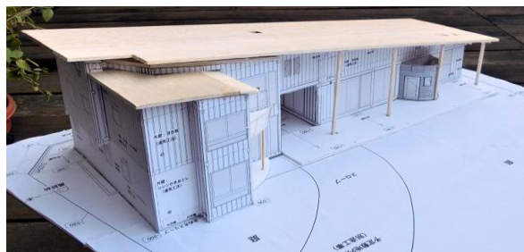
K邸 スタディーモデル

完成する前の木組みの構造が露わになった興味深い木の建物の見学会です。現行建築基準法をクリアした新伝統構法です。住む人に添った、暖かくて、涼しい安全な建物です。国産材だけを使っています。適切なメンテナンスにより、200年は建っているだろう建物です。30年で壊す建物が、7回建てられます。費用は住宅メーカーの良い部類の住宅一回分の建設費とおなじです。大手メーカーのように宣伝出来ないの、殆どの人に知られていません。また、この建物の付近に近づくと、とても良い木のかおりがします。住んでいる人は勿論、この建物のそばを散歩する人の癒しになります。ギスギスした世の中、穏やかにくらしたいと誰もが思っていますから。すこしは、社会貢献になると良いな！