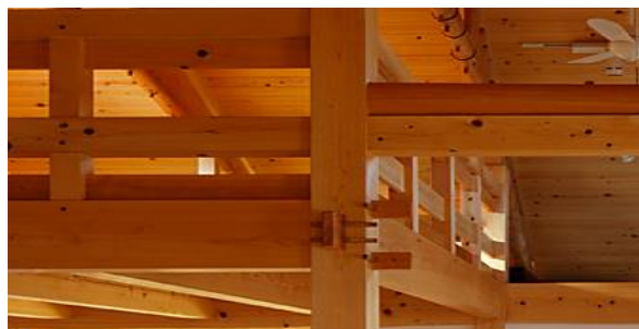
伝統工法の例 柱と梁の仕口 鼻柱